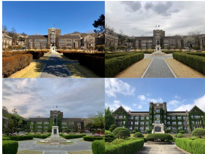
圖、交換期間大樓的變化

我選擇的是位於首爾的延世大學，是韓國著名三大學校 SKY(首爾大、延世大、高麗大)中之一，在韓國頗具盛名，為頂尖私校之一，本校區位於新村地區，鄰近梨大、弘大，地理位置十分便利，校園內風景壯麗，建築也十分有特色，隨著季節變化可以發現校園不同的面貌。學生會館內有銀行、花店、學餐等等，應有盡有，課程選擇上提供了 Study Abroad Courses 給交換生選擇，也有英文授課的專業課，無論是課業、功能、名譽、地理位置，皆是十分優秀的學校。