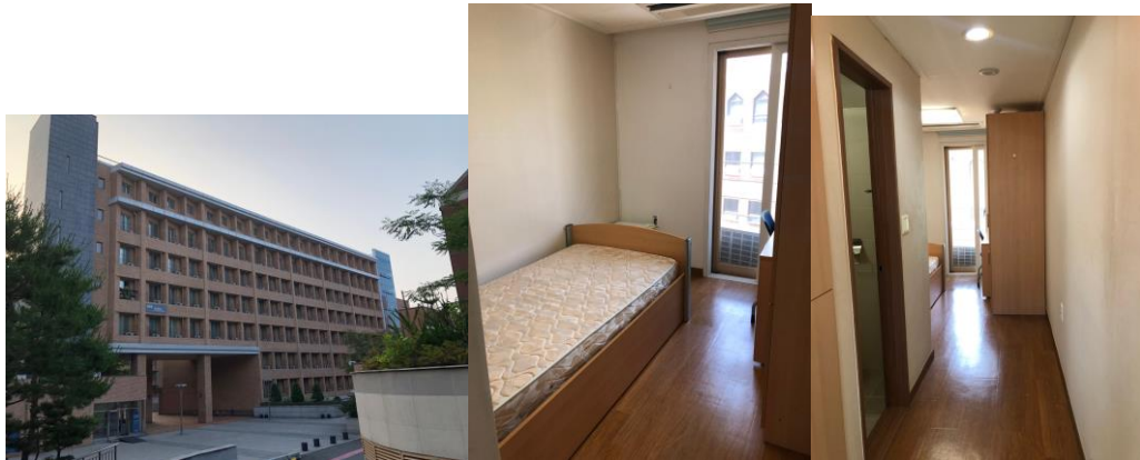
圖、SK 外觀以及單人房內部照片